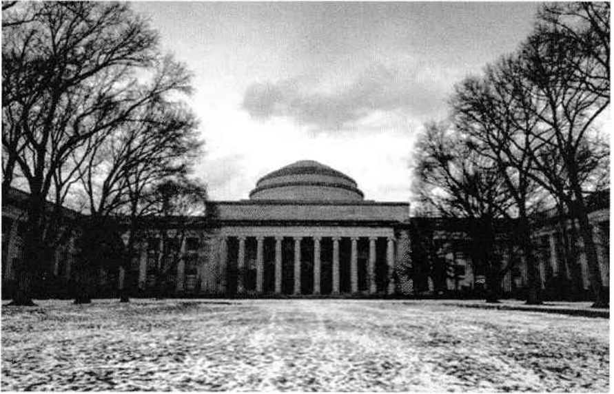
Massachusetts Institute of Technology

practică pentru înțelegerea a ce înseamnă gramatica generativă și care sunt principiile sale teoretice.